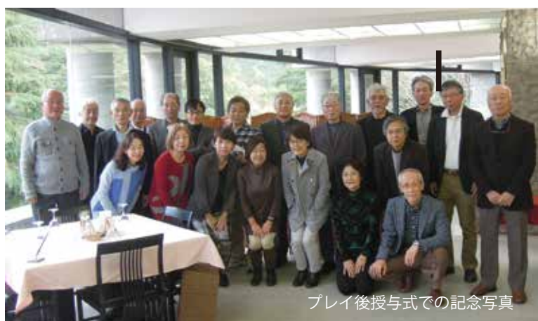
プレイ後授与式での記念写真

続きまして、第33回大会は、2017年11月17日レイク相模カントリークラブにて開催しました。当日は、爽やかな秋晴れの中、紅葉に色付いた木々がプレイヤーを歓迎しているようです。今年度最後の大会は、6組21名（内女性6名、初参加1名）のご参加をいただき無事プレイを終了しました。