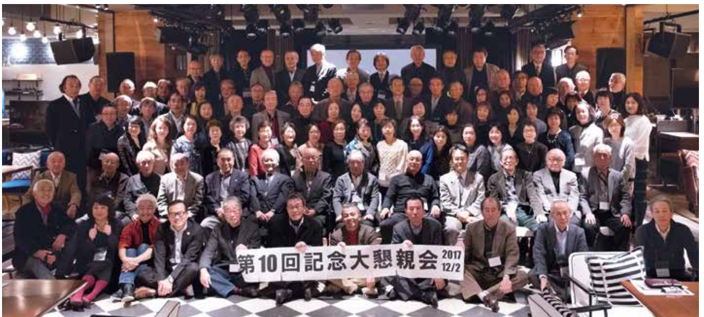
第10回ヤマハ音楽振興会同窓会 大懇親会(2017年12月2日)より

最後に、この一年が皆様により良き年となり、またお元気な姿でお目にかかれることを楽しみにいたしております。