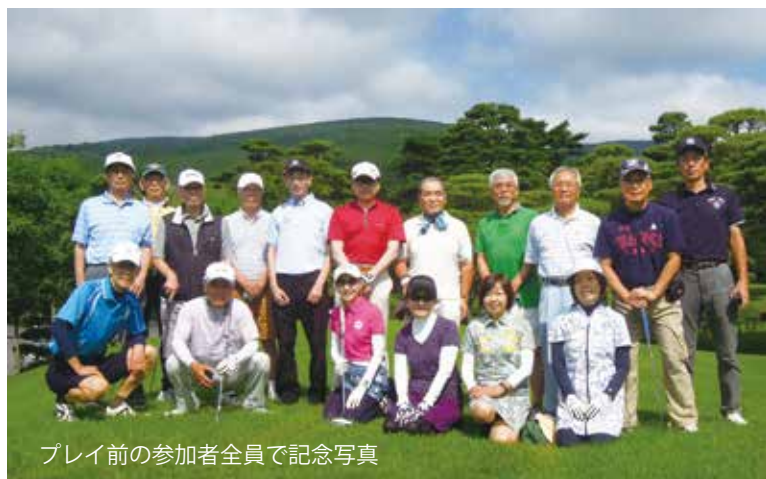
プレイ前の参加者全員で記念写真

第32回大会は、2017年7月20日竈坂ゴルフクラブにて開催しました。当日は、霞みがかった天候と標高800mの高原で、都心に比べ暑さを感じないゴルフ日和となりました。雄大な富士山は残念ながら拝むことはできませんでしたが、5組17人の参加者（内女性4名）は無事プレイを終了することができました。