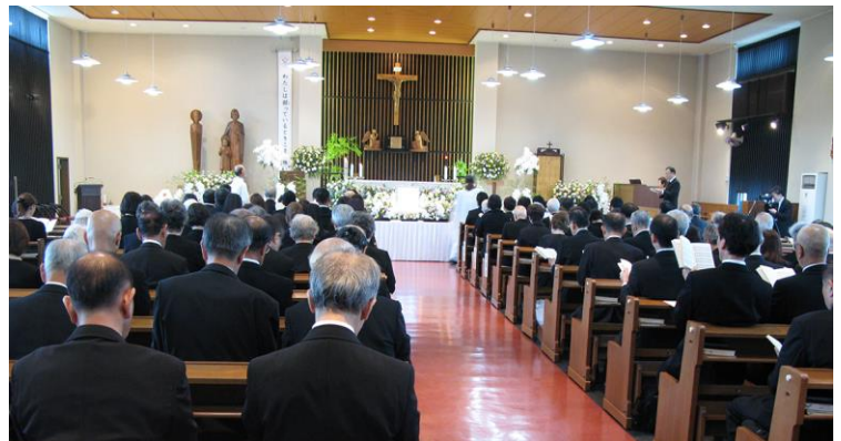
三軒茶屋教会でのミサ(9月7日)